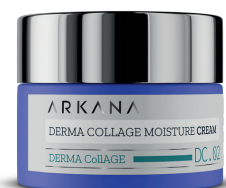
DERMA COLLAGEN MOISTURE CREAM